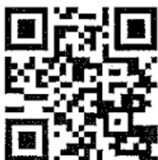
QR Code สำหรับลงทะเบียน