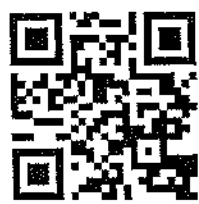
QR Code สำหรับลงทะเบียน