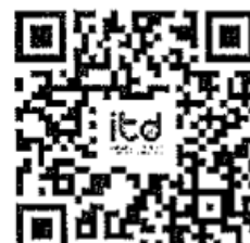
QR Code Facebook Live