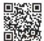
QR-Code เพื่อจองห้องพัก

โทรศัพท์: ๐๒-๔๒๒-๙๒๒๒ E-mail : rsvn@royalriverhotel.com