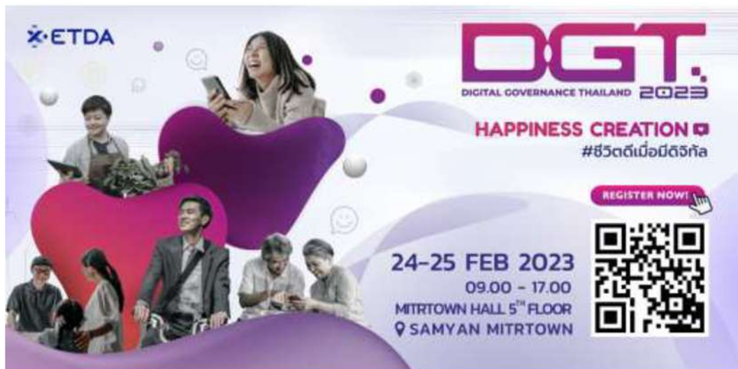
ตัวอย่าง Banner