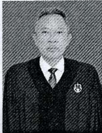
นายเกียรติภูมิ แสงศศิธร อธิบดีศาลปกครองนครราชสีมา