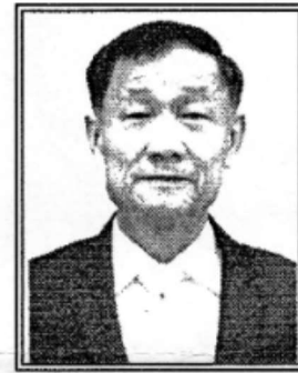
พลเรือเอก ประสาน สุขเกษตร (ด้านการส่งเสริมสิทธิและเสรีภาพของประชาชน)