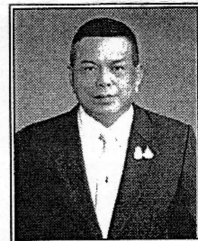
พลโท มณฑล ปราการสมุทร (ด้านการคุ้มครองผู้บริโภค)