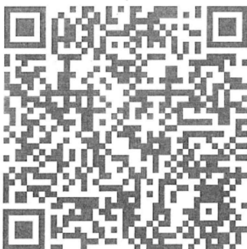
รูปที่ 2 QR Code ใบสมัครเข้าร่วมโครงการ